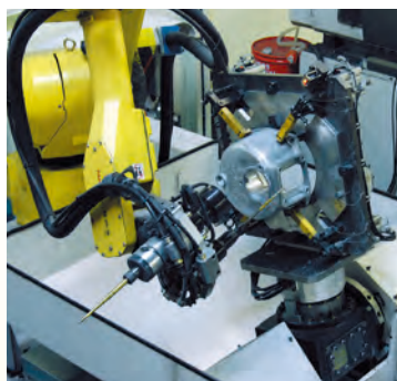
Öntvény megmunkáló robot