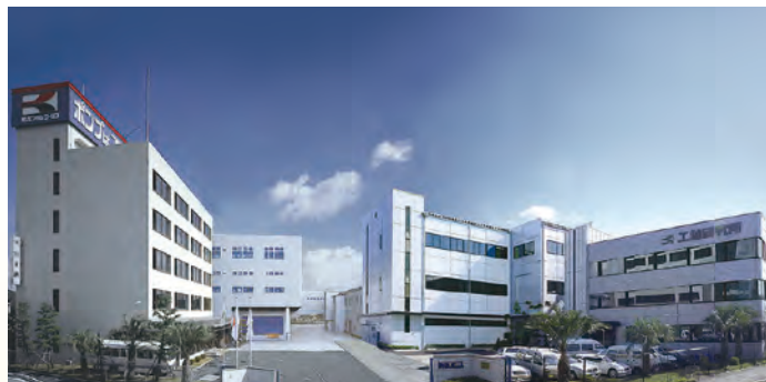
Központi iroda és gyártó csarnok